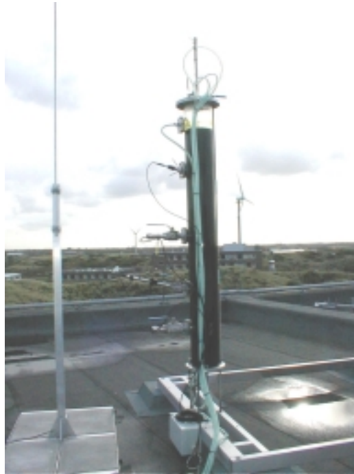
De ECN bench scale bioreactor